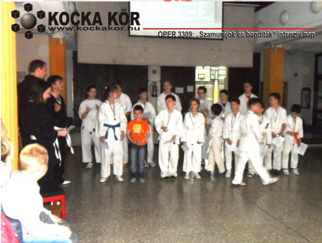
OPER 3309: „Szamurájok és banditák” intenzív nap