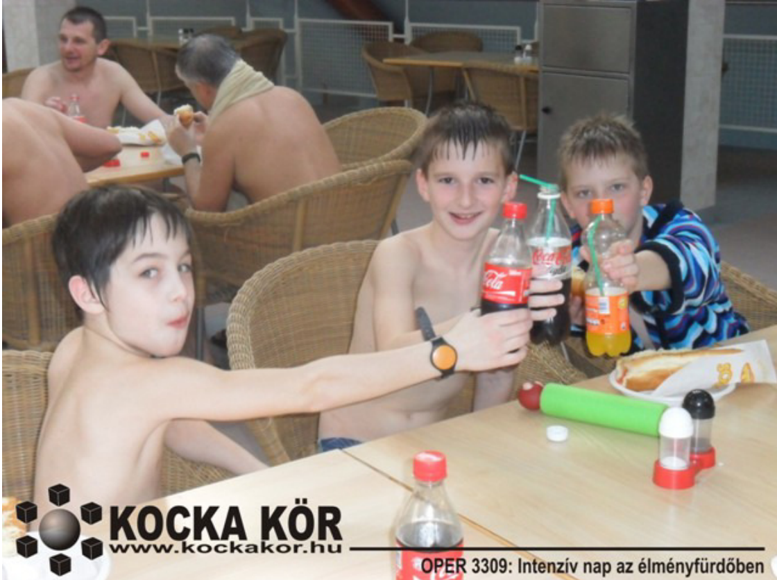
OPER 3309: Intenzív nap az élményfürdőben